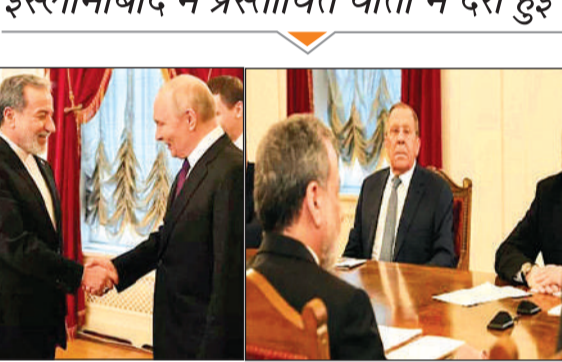
ईरान के विदेश मंत्री अब्बास अराघवी ने रूस के राष्ट्रपति व्लादिमीर पुतिन से की मुलाकात