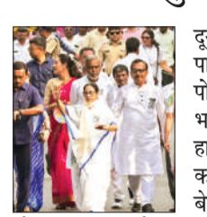
▶ कोलकाता

दूसरे चरण की वोटिंग से पहले मुख्यमंत्री ममता बनर्जी ने अपनी पार्टी की जीत को लेकर बड़ा दावा किया है। सोमवार को एक्स पर पोस्ट करते हुए ममता ने कहा कि मां, माटी, मानुष की जीत अब भविष्यवाणी नहीं, बल्कि सिर्फ समय की बात है। उन्होंने कहा कि हाल ही में आयोजित पदयात्राओं और जनसभाओं में आम लोगों का जबरदस्त उत्साह, स्नेह और भावनात्मक समर्थन देखकर वह बेहद प्रभावित हुई हैं। ममता ने कहा कि पश्चिम बंगाल सदियों से सौहार्द, संस्कृति और सभ्यतागर्भ गौरव का प्रतीक रहा है। उन्होंने विपक्ष पर निशाना साधते हुए कहा बंगाल की जागरूक और एकजुट जनता लोकतांत्रिक जवाब देगी।