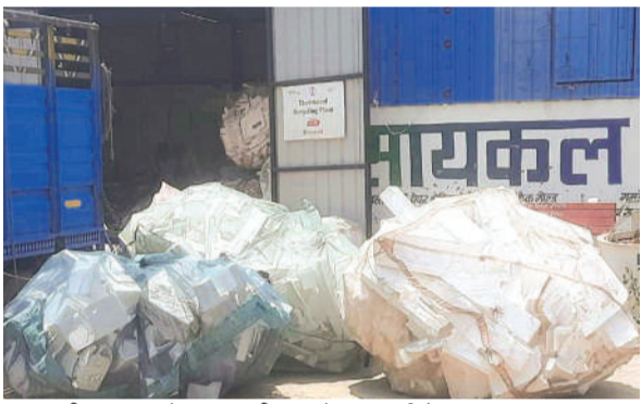
दाना पानी ट्रांसफर स्टेशन पर बड़ी मात्रा में रखा थर्माकोल।

कम मिल रहा है राजस्व, जबकि जमीन, शेड निगम ने कराए हैं मुहैया