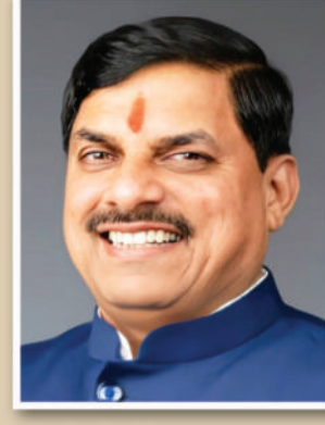
डॉ. मोहन यादव मुख्यमंत्री, मध्यप्रदेश