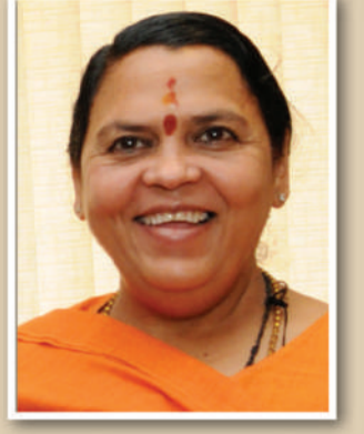
सुश्री उमा भारती पूर्व मुख्यमंत्री