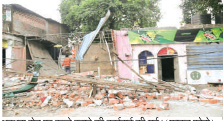
भदभदा रोड पर कब्जे हटाने की कार्रवाई की गई।