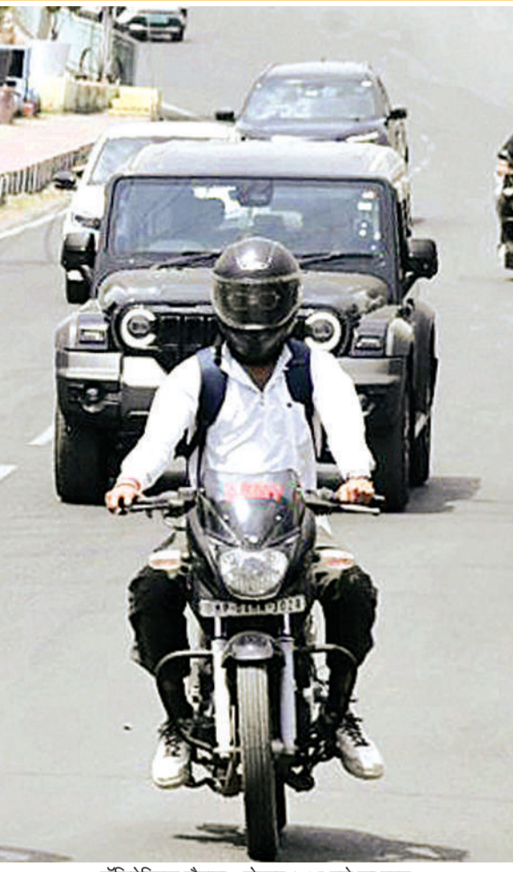
पॉलिटेक्निक चौराहा: दोपहर 1.35 बजे का दृश्य