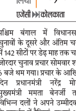
पश्चिम बंगाल में विधानसभा चुनावों के दूसरे और अंतिम चरण में 142 सीटों पर डेढ़ माह तक चला जोरदार चुनाव प्रचार सोमवार शाम 6 बजे थम गया। प्रचार के आखिरी दिन प्रधानमंत्री नरेंद्र मोदी, मुख्यमंत्री ममता बेनर्जी तथा विभिन्न दलों ने अपने उम्मीदवारों के समर्थन में रैलियां, सभाएं और रोड-शो किया। दूसरे चरण में 29 अप्रैल को ▶▶ शेष पेज 6 पर

पं. बंगाल में दूसरे चरण का चुनाव प्रचार थमा