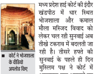
मध्य प्रदेश हाई कोर्ट की इंदौर खंडपीठ में धार स्थित भोजशाला और कमाल मौला मस्जिद विवाद को लेकर चल रही सुनवाई अब तीखे टकराव में बदलती जा रही है। तीसरे हफ्ते की सुनवाई के पहले ही दिन मुस्लिम पक्ष ने कोर्ट में आक्रामक रुख अपनाते हुए साफ शब्दों में कहा- जिसे पहले ही मस्जिद माना जा चुका है, उसे बार-बार ▶▶ शेष पेज 6 पर

केंद्रीय बलों के कमांडरों ने तैयारियों का जायजा लिया