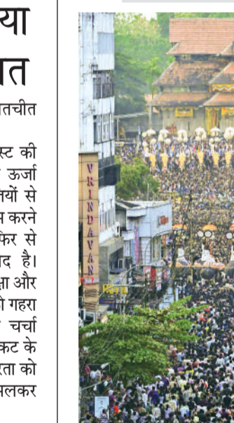
त्रिशूर पूरम कुटानट्टम अनुष्ठान संपन्न