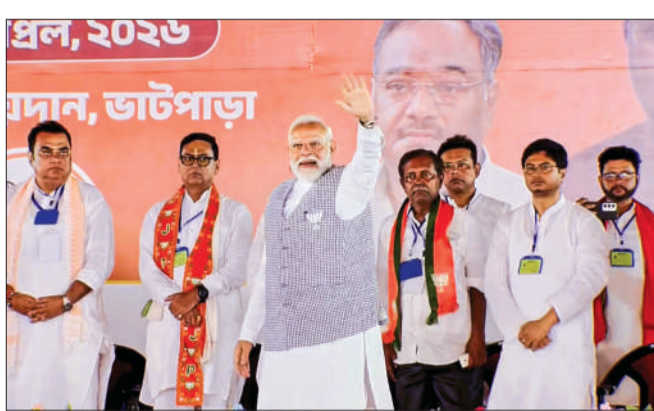
नॉर्थ 24 पराना जिले के बैरकपुर में पीएम मोदी चुनाव रैली में लोगों का अभिवादन करते हुए