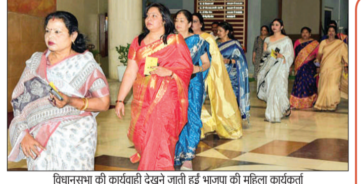
विधानसभा की कार्यवाही देखने जाती हुई भाजपा की महिला कार्यकर्ता

सत्ता पक्ष व विपक्ष के बीच करीब 8.30 घंटे से ज्यादा समय तक चर्चा