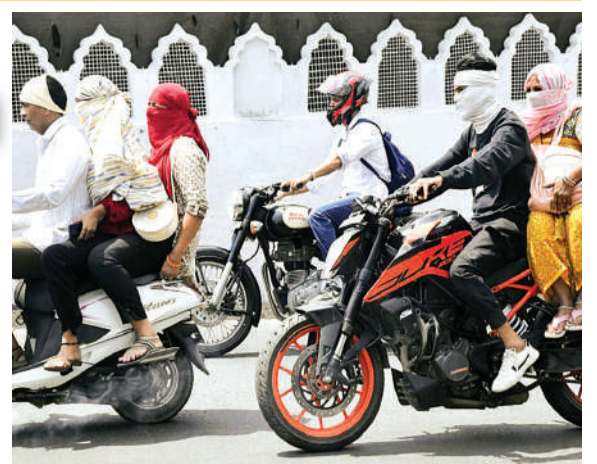
कमला पार्क की सड़क का दृश्य, दोपहर 1.30 बजे