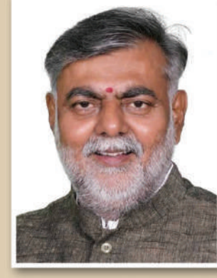
श्री प्रहलाद सिंह पटेल मंत्री, पंचायत एवं ग्रामीण विकास, श्रम