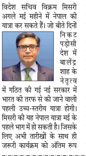
विदेश सचिव विक्रम मिसरी

नई दिल्ली नहीं दिया गया है। लेकिन इस दौरान विदेश सचिव की होने वाली मुलाकातों में दोनों देशों के द्विपक्षीय संबंधों से जुड़े हुए विभिन्न मुद्दों पर चर्चा करने के अलावा नेपाल में भारत की वित्तीय मदद से जारी परियोजनाओं की समीक्षा की जाएगी। यहां बता दें कि विदेश सचिव की यह नेपाल यात्रा की जानकारी एक ऐसे समय में सामने आई है। जब बीते दिनों नेपाल के प्रधानमंत्री बालेंद्र शाह के अपने पहले विदेश दौरे के तहत भारत पहुंचने को लेकर तेजी से कयास लगाए जा रहे थे। संभावना है कि मिसरी की इस यात्रा के साथ ही आगामी समय में इसे लेकर तस्वीर पूरी तरह से साफ हो सकती है।