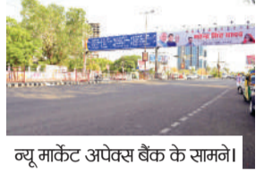
ब्यू मार्केट अपेक्स बैंक के सामने।