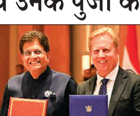
पीयूष गोयल और टॉड मैकले समझौते पर आधिकारिक रूप से हस्ताक्षर करते हुए वैश्विक बाजार में एक बड़ी कूटनीतिक और आर्थिक जीत मानी जा रही है।

भारत और न्यूजीलैंड के बीच द्विपक्षीय व्यापारिक संबंधों में सोमवार को एक नए युग की शुरुआत हुई। दोनों देशों ने एक ऐतिहासिक मुक्त व्यापार समझौते (एफटीए) पर हस्ताक्षर किए हैं, जो व्यापार, निवेश और रोजगार के क्षेत्र में व्यापक बदलाव लाने वाला है। वाणिज्य मंत्री पीयूष गोयल और न्यूजीलैंड के उनके समकक्ष टॉड मैकले की उपस्थिति में इस महत्वपूर्ण समझौते को आधिकारिक रूप दिया गया। यह समझौता भारतीय अर्थव्यवस्था और निर्यातकों के लिए