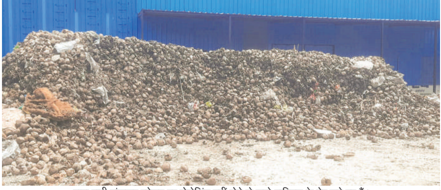
दाना पानी ट्रांसफर स्टेशन पर प्रोसेसिंग नहीं होने से सूखे नारियल के ढेर लगे हुए हैं।