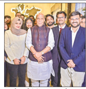
प्रवासी भारतीयों के साथ रक्षा मंत्री राजनाथ

सदस्य देशों के बीच रक्षा सहयोग बढ़ाना भी प्रमुख एजेंडा