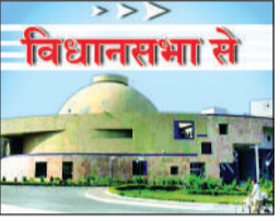
हरिभूमि न्यूज गोपाल