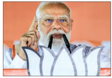
एजेसी ▶ कोलकाता

प्रधानमंत्री मोदी ने बैरकपुर में चुनावी रैली में एक बार फिर गारंटी वाला मास्टरस्ट्रोक खेला