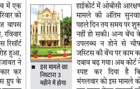
हाईकोर्ट में ओबीसी आरक्षण मामले की अंतिम सुनवाई पहले दिन तय समय पर शुरू नहीं हो सकी। अन्य बेंच के उपलब्ध न होने से चीफ जस्टिस की बेंच पर काम का दबाव बढ़ गया। अब कोर्ट ने स्पष्ट कर दिया है कि मंगलवार को इस मामले को पूरा समय देकर सुनवाई की जाएगी। सरकार के द्वारा नियुक्त अधिवक्ता के सरकार के खिलाफ बहस ▶▶ शेष पेज 6 पर