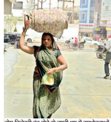
होम डिलेवरी बंद होने से तपती धूप में उपभोक्ताओं को गैस एजेंसी से सिलेंडर लाने पड़ रहे हैं।