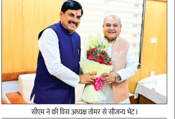
सीएम ने की विस अध्यक्ष तोमर से सौजन्य भेंट।

भोपाल। मुख्यमंत्री डॉ. मोहन यादव ने कहा कि आज के इस सत्र में दोनों पक्षों ने अच्छी बात कही है। यहाँ आधी आबादी के भाई के नाते उपस्थित हूँ। हमने अपनी वसुंधरा के साथ तुम सत्ता के साथ भावनाओं को जोड़ा है। कांग्रेस से कहना चाहता हूँ कि तू इधर उधर की बात न कर, ये बता कि कारवां लुटा क्यों? कांग्रेस ने 42 वां संविधान संशोधन कर साबित कर दिया था कि अब लोकसभा में कोई सीट नहीं बड़ेगी। कांग्रेस ने बहनों के साथ अन्याय किया। आधी आबादी का आरक्षण रोककर कांग्रेस ने उनका गला घोट। कांग्रेस ने पाप किया। मुख्यमंत्री डॉ. यादव सोमवार को मप्र विधानसभा के विशेष सत्र के समापन पर अपने जवाब में बोल रहे थे। इस सत्र में नारी शक्ति वंदन 7 घंटे तक चली। चर्चा के लिए विधानसभा अध्यक्ष नरेंद्र सिंह तोमर ने वैसे तो 4 घंटे का समय रखा था, किंतु यह काफी देर तक चलती रही। चर्चा के दौरान कोई लंच ब्रेक नहीं हुआ। सदन के लॉबी में सदस्यों के भोजन की व्यवस्था थी।