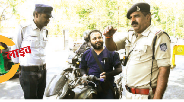
पुलिस कंट्रोल रूम के सामने चालानी कार्रवाई करती ट्रैफिक पुलिस।