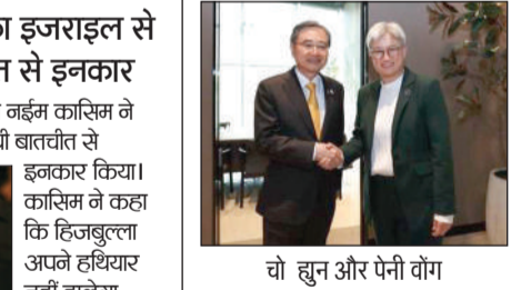
चो ह्युन और पैनी वॉंग

दक्षिण कोरिया के विदेश मंत्रालय ने एक बयान में कहा कि है कि विदेश मंत्री चो ह्युन गुंवर को सियोल में अपने ऑस्ट्रेलियाई समकक्ष पेनी वॉंग से द्विपक्षीय बातचीत करने के लिए मिलेंगे। दोनों पक्षों से मिडिल ईस्ट की मौजूदा हालात और वैश्विक ऊर्जा संकट से जुड़ी आम चुनौतियों से निपटने के लिए मिलकर काम करने की अपने प्रतिबद्धता को फिर से सुनिश्चित करने की उम्मीद है। उन्होंने यह भी कहा कि वे रक्षा और रक्षा उद्योग क्षेत्र में सहयोग को गहरा करने की कोशिशों पर भी चर्चा करेंगे। इसमें मिडिल ईस्ट संकट के बीच सप्लाय चैन की अस्थिरता को दूर करने के लिए मिलकर कोशिशें शामिल हैं।